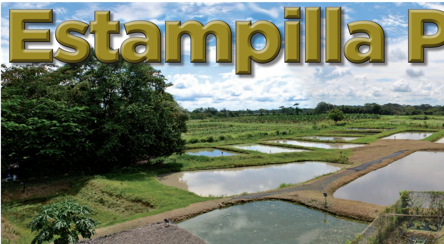
Pozos piscícolas. IALL - Unillanos