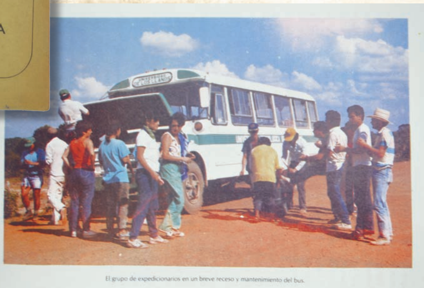
El grupo de expedicionarios en un breve receso y mantenimiento del bus.

Entre el 5 y el 24 de enero de 1987 un grupo de estudiantes, profesores y administrativos, realizó la primera “Expedición a la Orinoquia Colombiana” recorriendo rutas terrestres y fluviales de Meta, Vichada, Arauca y Casanare, también geografía venezolana pues en Puerto Carreño los expedicionarios pasaron el río Orinoco. Transitando luego por el Estado Apure regresando al país por la ciudad de Arauca.