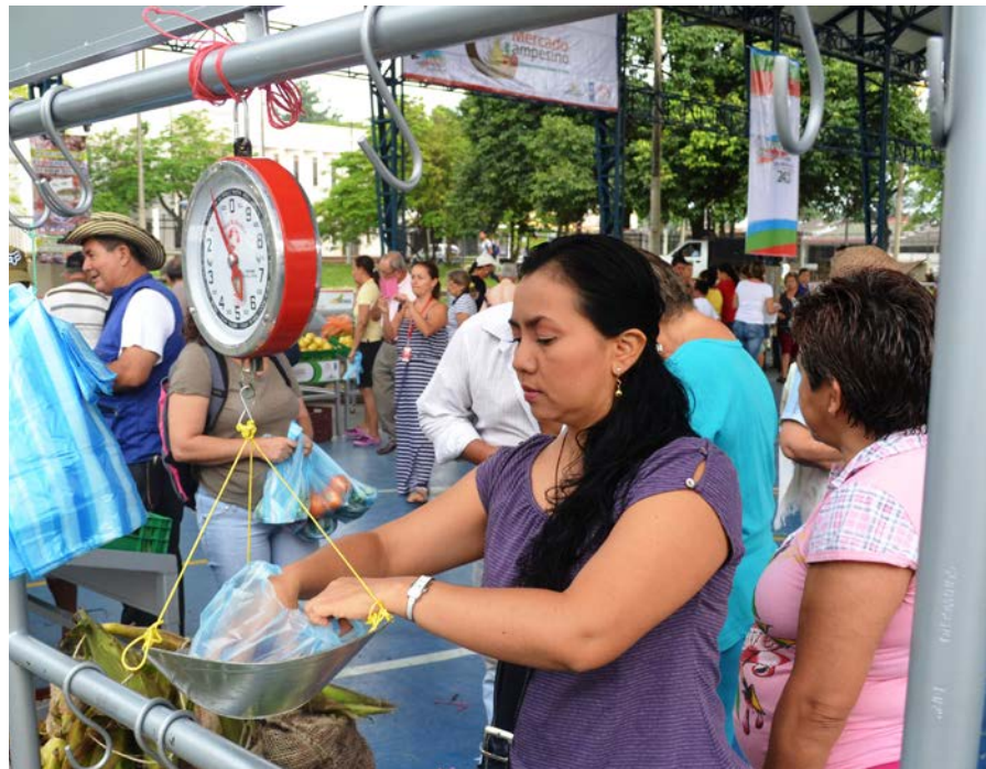
Los productores han participado en mercados campesinos de otras ciudades.

Con el apoyo de instituciones nacionales e internacionales esta idea se ha extendido a municipios como Puerto López, Puerto Gaitán, El Dorado, San Juan de Arama, San Juanito, Puerto Rico, Puerto Concordia, entre otros; en los cuales se dan empujes de la misma índole: un proceso de fortalecimiento y de articulación con una iniciativa que debería constituirse en un gran