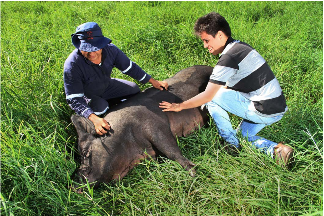
La vocación y orientación para trabajar por el otro, con características de los proyectos de la Universidad de los Llanos.

La facultad ha trabajado en el beneficio de los productores del Meta y la Orinoquia. En los últimos años, ha robustecido su proyección social, aportando desde diferentes ámbitos, como por ejemplo, el fortalecimiento del Cluster de Pan de Arroz.