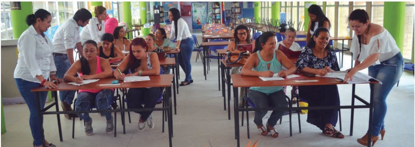
Capacitación a mujeres microempresarias del barrio Porfía de Villavicencio.