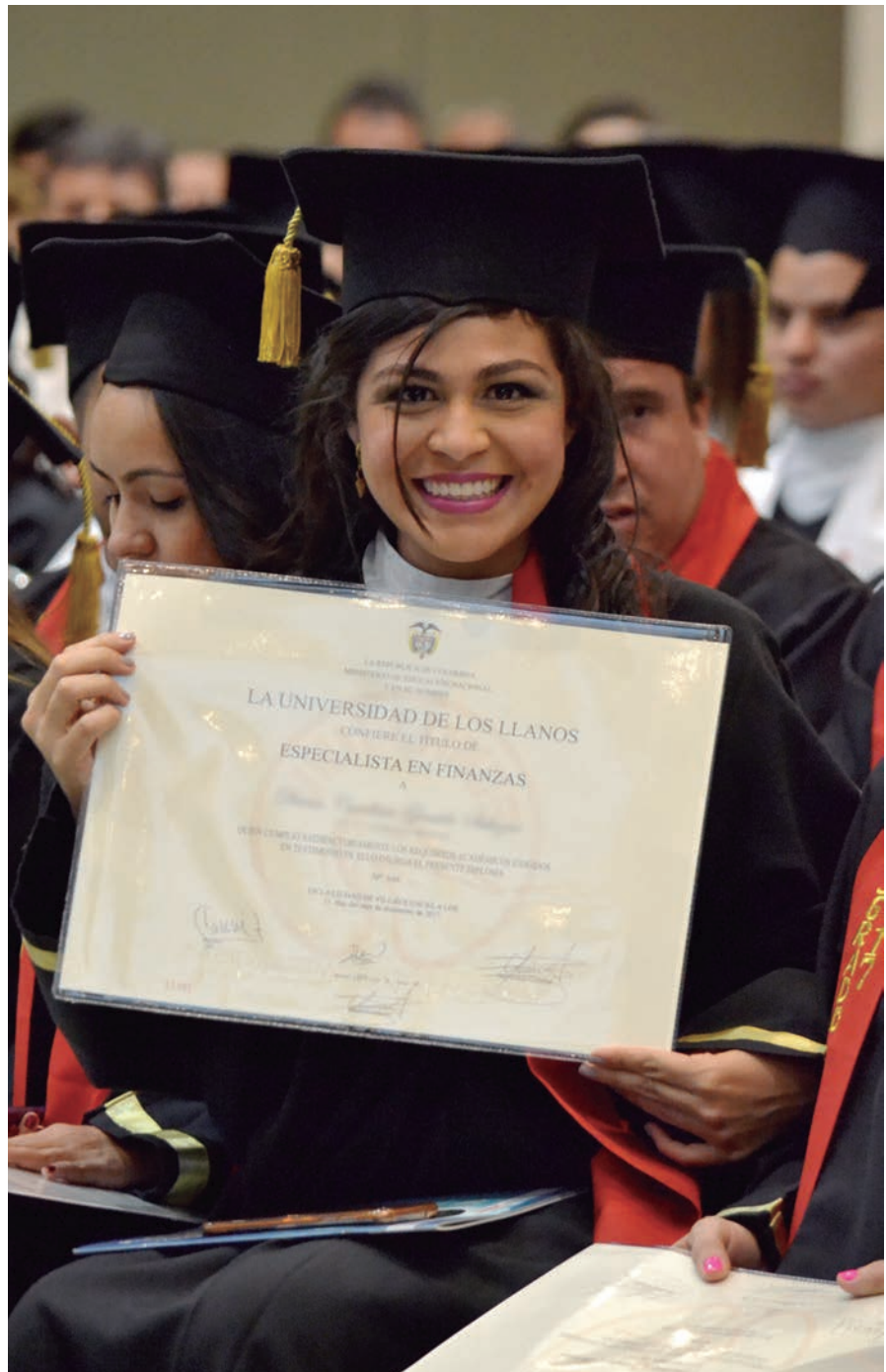
Cifras que muestran la excelencia académica y calidad de los docentes

Dicho estudio también permitió conocer la opinión de los empleadores quienes han conocido de primera mano la calidad de los egresados de la universidad que destacan el compromiso, la formación académica, la ética profesional, el