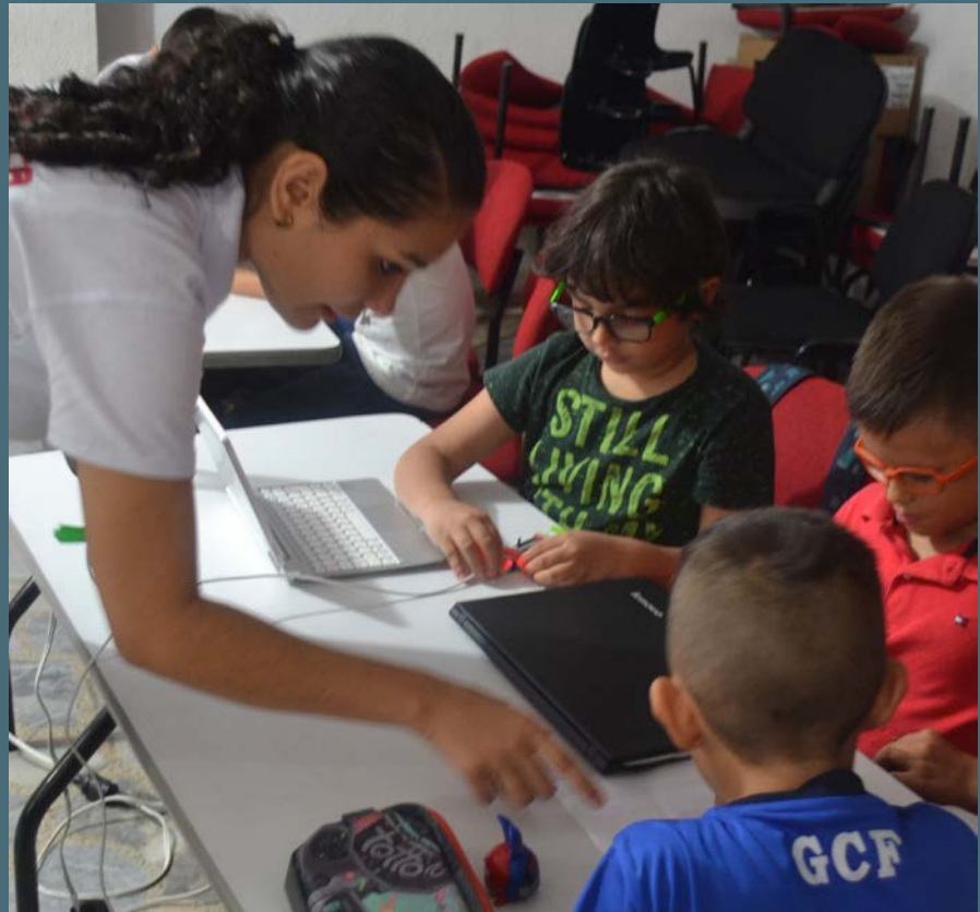
Los niños aprenden sobre robótica de forma lúdica

Durante los primeros talleres, los niños entre los 8 y 14 años aprenden cómo se compone la tecnología de elementos básicos. Se les muestran que aquello que pueden palpar o ver ha sido programado